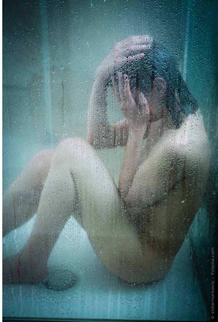
Viele Prostituierte leiden an psychischen Störungen.

Die Chance, eine Posttraumatische Belastungsstörung zu entwickeln ist bei prostituierten Frauen viel größer als bei Soldaten im Krieg. Frauen werden also an eine Front geschickt. Aber um welche Front handelt es sich? Um welchen Krieg? Für was gehen sie in den Krieg? Ist es, um unsere Demokratie und Freiheit zu verteidigen? Nein! „Das Leben und die Rechte dieser Frauen werden dafür geopfert, dass einige ihre sexuelle Lust ausleben kön-